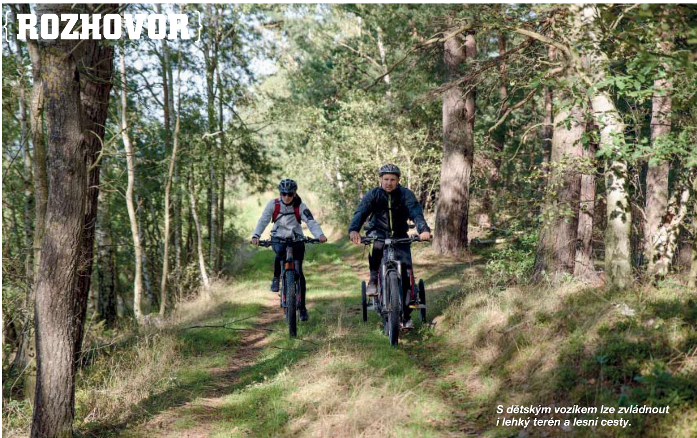
S dětským vozíkem lze zvládnout i lehký terén a lesní cesty.

v menším kopci. Rozdíl je určitě při manipulaci, tam už to cítíte, když máte běžet čtyři patra s normálním kolem anebo o deset kilo těžším elektrokolem. Ale na to, co elektrokolo umí, tak kilogramy navíc vůbec nevadí. E-bike může dát člověku tolik zábavy, že tu váhu při tahání prostě oželíte.