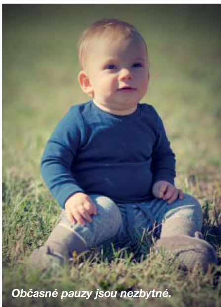
Občasné pauzy jsou nezbytné.