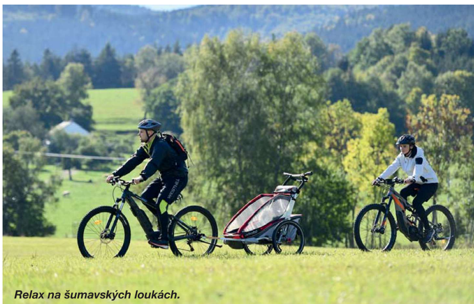
Relax na šumavských loukách.

pohupoval a neskutečně mě to bavilo. Z kopce na louce jsem kličkoval a bylo to jako slalom na lyžích... Je to úžasně komfortní a člověk má k tomu relativně těžkému elektrokolu velkou důvěru. Prostě jedeš a víš, že to skvěle sedí a že tě to nezradí, něco jako dobře naladěný podvozek v autě, prostě paráda! V těžších sjezdech v těch korytech s kameny a kořeny jsem šel trochu za sedlo a nechal elektrokolo, ať si samo najde cestu mezi dírami, a jenom trochu korigoval brzdy a směr. Sice nejždím žádný downhill, ale všechno jsem dokázal sjet bez problémů hlavně díky tomu skvělému stroji.