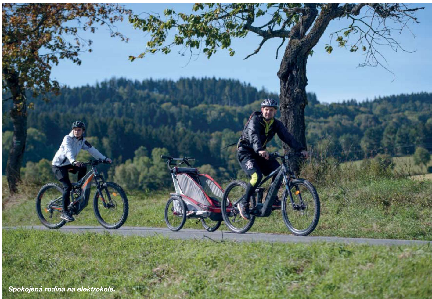
Spokojená rodina na elektrokole.

zase vracím naším společným časem, jak můžu.